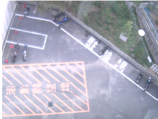
図 2 原画像

撮影された原画像はカラー画像のため、エッジ抽出の前に濃淡画像へ変換する。濃淡画像に変換することで、路面と区別しにくい色の車両を認識しやすくする。原画像を図 2 に示す。