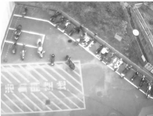
図 3 濃淡画像

次に画像を補正するため、変換された濃淡画像に対し対数変換を行う。これは影などによる明るさのムラを減らすためである。対数変換を行った場合画像の暗い部分が補正され、画像が強調される。図 3 と図 4 に、変換前と変換後の画像をそれぞれ示す。