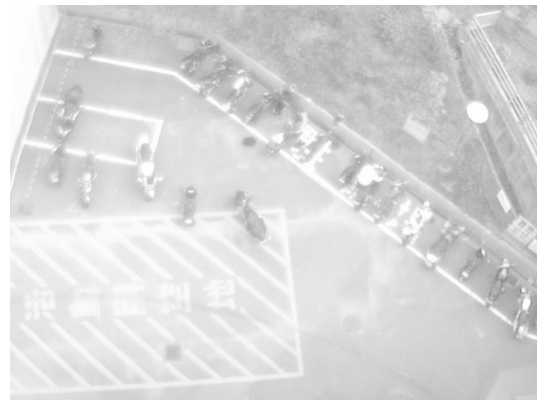
図 4 対数変換画像