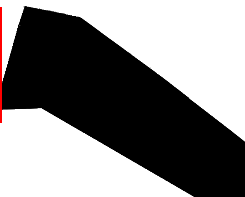
図6 テンプレート画像

発表用に作成する予定のテンプレートを適用したオリジナル画像、すなわち処理対象部分が残っていてテンプレート外の部分が黒塗りになっている画像が図6の次にほしい。