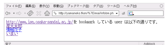
図 3: ある URI について誰が Bookmark しているのかを調べる page